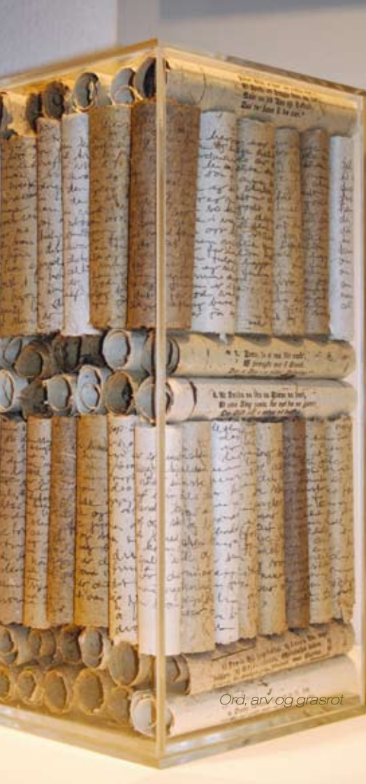
Ord, arv og grasrot